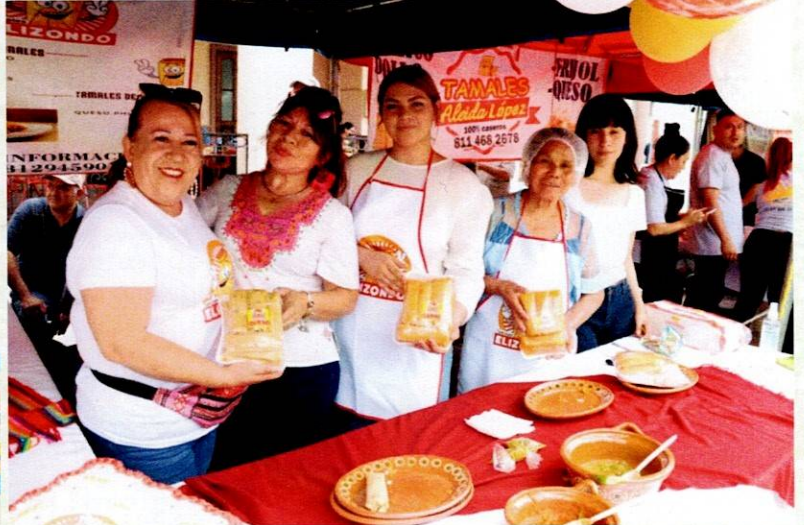
TAMALES DE JUAREZ, N.L. UN GRAN ORGULLO